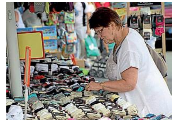
Bei einer so großen Auswahl an Socken wird ja wohl was Passendes dabei sein.