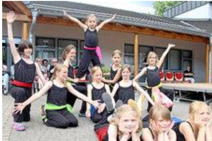
Die jungen Jazztänzerinnen des TV Hartenrod zeigten auf der Bühne ihr Können.

Ebenso wenig durften die Musiker des Jugendharmonika-Orchesters fehlen, die vor dem Dorfzentrum ihr alljährliches Kurkonzert gaben und die Besucher mit bekannten Melodien unterhielten.