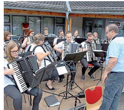
Das Jugendharmonikaorchester gab vor dem Dorfzentrum wieder sein alljährliches Kurkonzert im Rahmen des Johannismarktes.